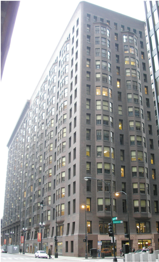
دپارتمان مهندسی پوسته شرکت سکو ایران